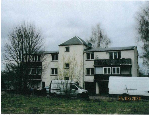
01 Vorderansicht, Südseite